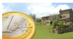
Low Cost Agriturismo Umbria